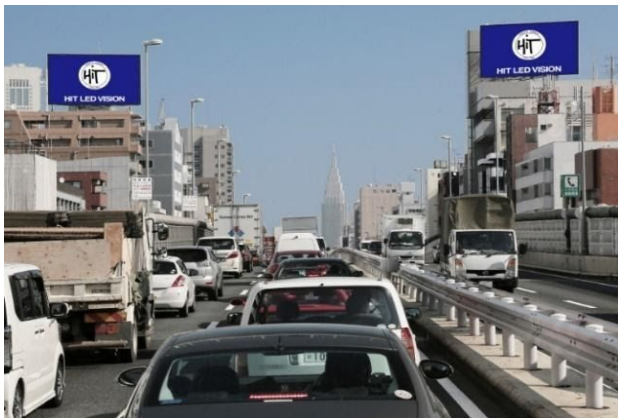
首都高速デジタルLEDボード