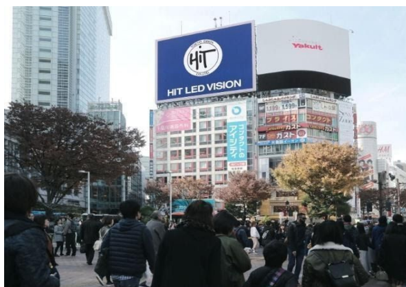
シブハチヒットビジョン