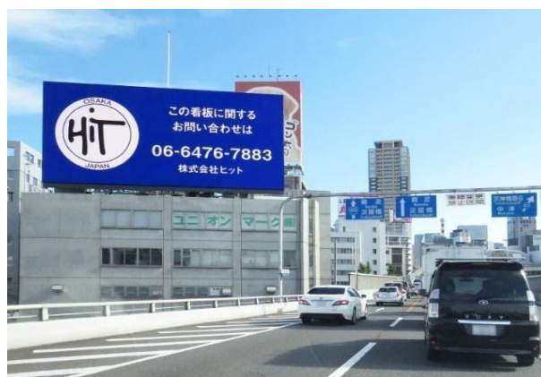
新御堂筋デジタルLEDボード