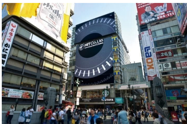
ツタヤエビスバシヒットビジョン